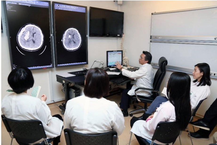
Foto 4: Os residentes podem tratar, de forma mais conveniente, vários serviços médicos online