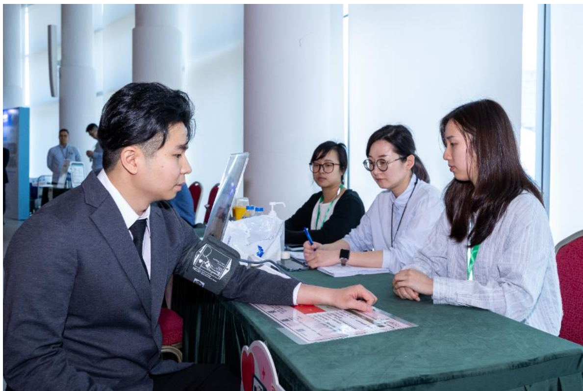
附圖 3：實施“健康企業”計劃五大關鍵