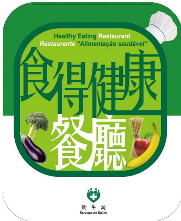
圖 1. “食得健康餐廳” 標誌牌