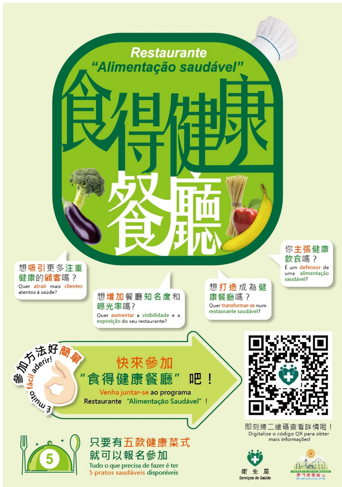
圖 5. 衛生局“食得健康餐廳”計劃